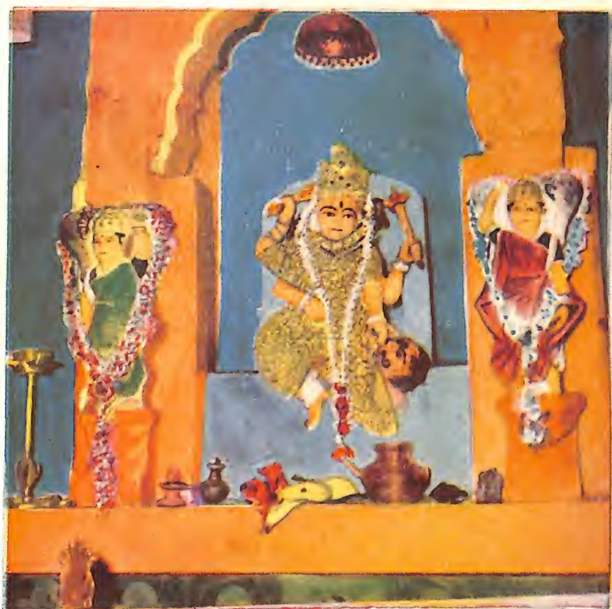
भगवती श्री पीताम्बरा बगला